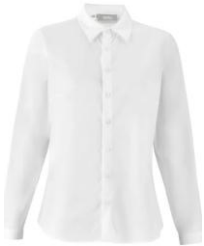
Chemisier manches longues Chenin blanc