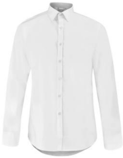
Chemise manches longues Cattura blanche