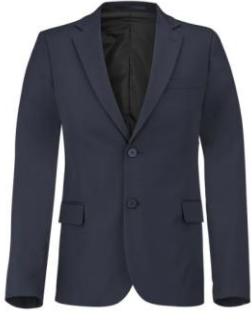
Veste de service Kontir bleu marine