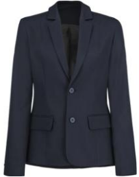
Veste Cortado Lafont bleu marine