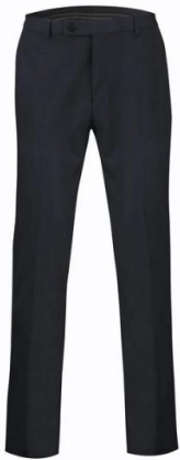
Pantalon service slim Harrar Bleu marine

Prix ensemble service+ foulard ou cravate logotée « Lycée Hôtelier » :